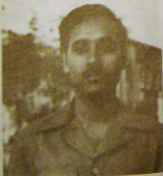
৪। মেজর খন্দকার আবদুর রশিদ, অধিনায়ক দ্বিতীয় ফিল্ড আর্টিলারী। তিনি মেজর ফারুকের ভায়রা ভাই এবং মুজিব হত্যার সাথী বন্ধু।