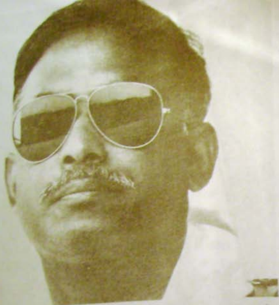
২। মাতকদের হাতে নিহত প্রেসিডেন্ট জিয়াউর রহমান।