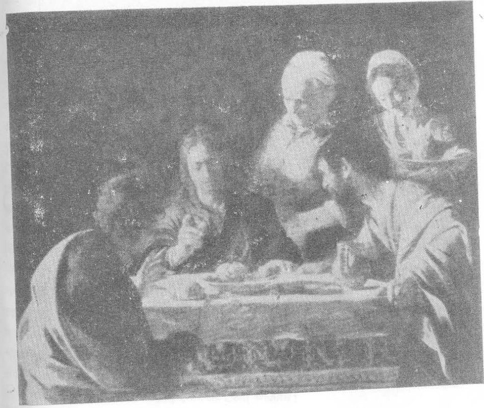
‘ইস্রায়ুস’-এর পাহুশালায় যীশু - নকল ভেরমেয়ার (মীগেরেঁ-কৃত)