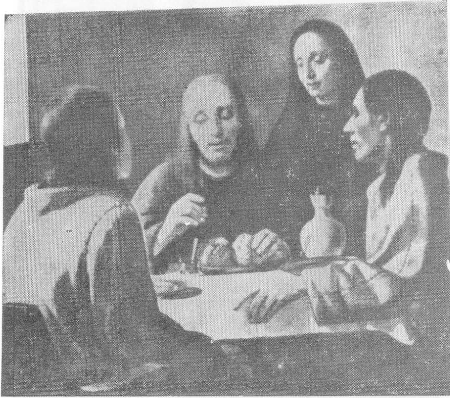
‘ইস্রায়ুস’-এর পাহুশালায় যীশু-কারাভাগগো